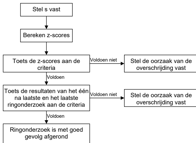
Figuur Stappenschema toetsing ringonderzoek resultaten

In het volgende processchema is het een en ander ter verduidelijking grafisch weergegeven.